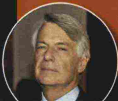
Nel tondo, Ferruccio De Bortoli, giornalista ed ex direttore del Corriere della sera, intervenuto alla serata.

Ritaglio stampa ad uso esclusivo del destinatario, non riproducibile.